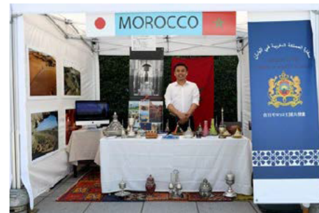
市内での交流イベント (今のアフリカ)