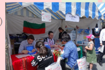
ブルガリアブース出展