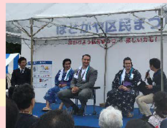
鳴門親方との交流