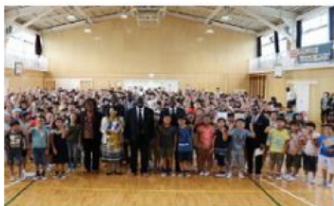
桜岡小学校児童との交流