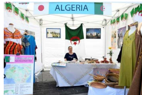
市内での交流イベント (今のアフリカ)