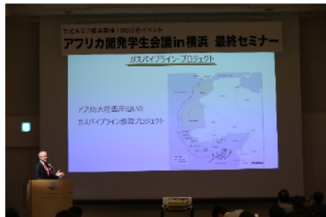
アフリカ開発学生会議 (モロッコ大使のプレゼン)