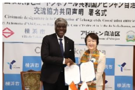
笑顔のアビジャン自治区マンベ知事(左)と林市長