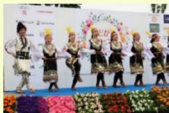
ほどがや花フェスタ