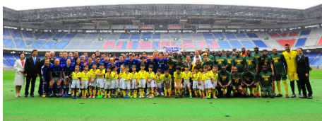
TICAD7親善交流イベント