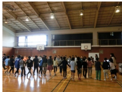
大使館員による講演 (本牧南小学校)