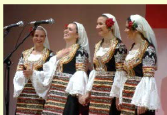
アバガル・カルテット 来日記念講座