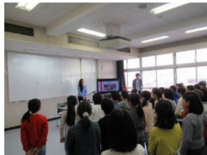
モロッコ王国出身者との交流 (桂小学校)